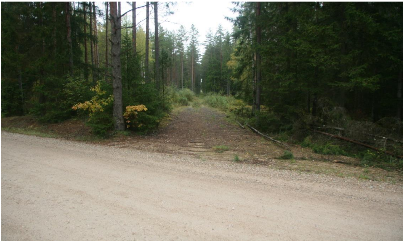
Foto 1. Kiisaniidu tee algus.

Liikluskorraldusvahendeid esineb piirkonnas minimaalselt. Piiratud nähtavuse tõttu ning liiklusohutuse suurendamiseks tuleks metsa väljaveo ajaks riigiteele mõlemale poole Kiisaniidu tee mahasõitu paigaldada kiirust piiravad ajutised liiklusmärgid.