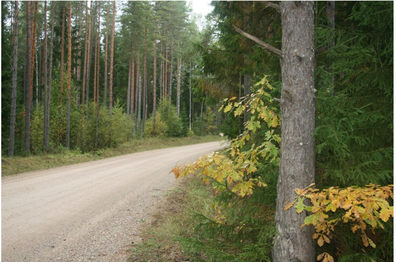
Foto 4. Kiisaniidu tee ristumine riigiteega, vaade paremale.

Projektiga rajatav Tapusaarõ tee kulgeb metsasihil (foto 5).