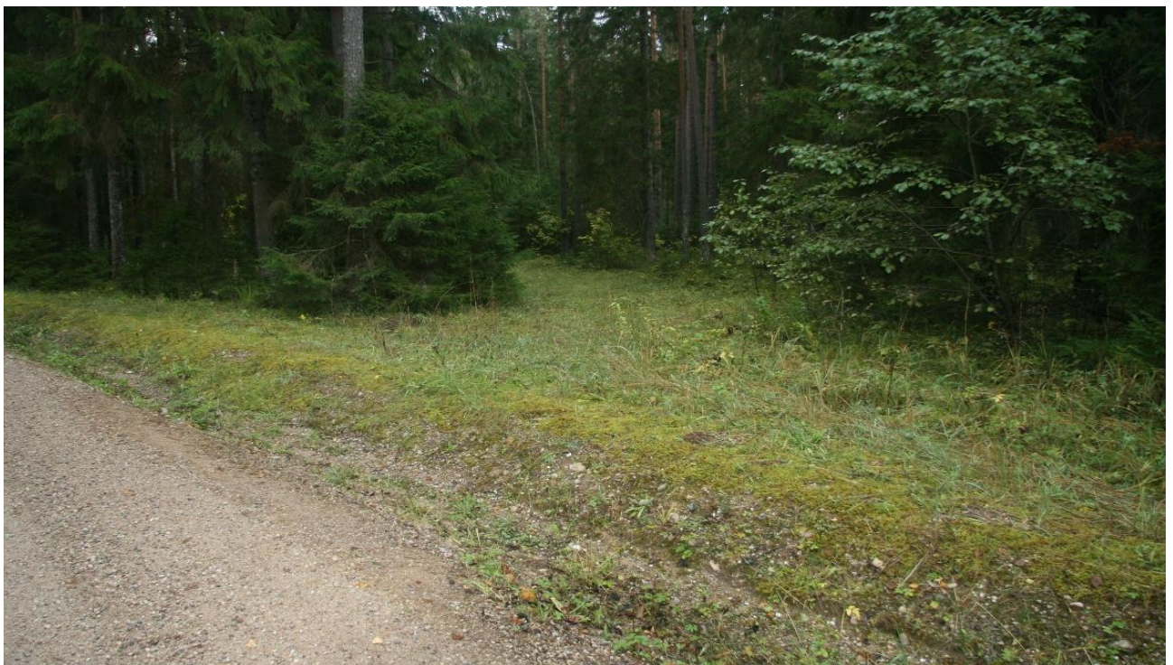
Foto 5. Tapusaarõ tee lõikumine riigiteega.

Projektiga rajatav Tapusaarõ tee kulgeb metsasihil (foto 5).